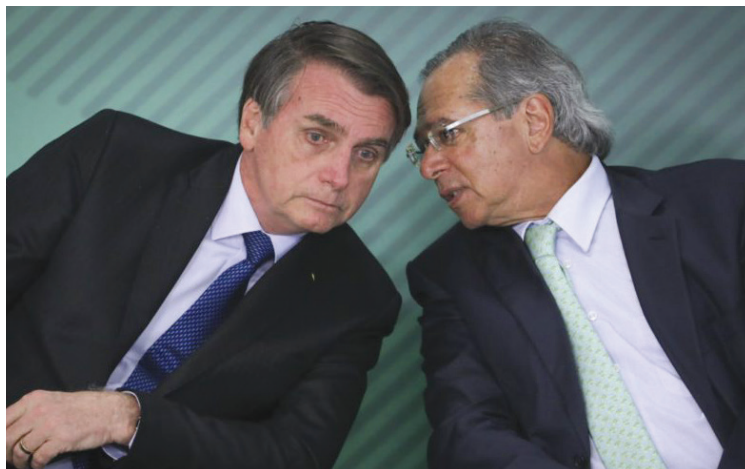
Bolsonaro e seu ministro da Economia, o banqueiro Paulo Guedes